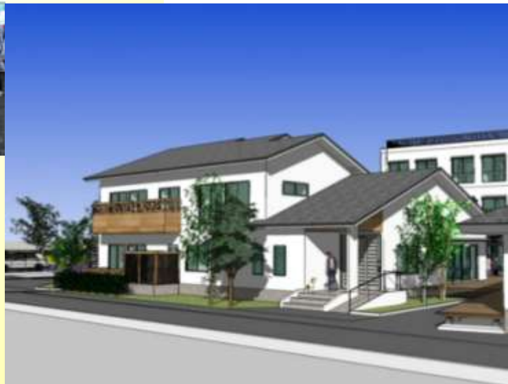
しあわせの杜 ケアレジデンスとまり木 (完成予想図)