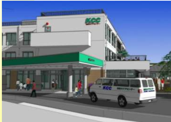
しあわせの杜 ケアレジデンス おはな (完成予想図)