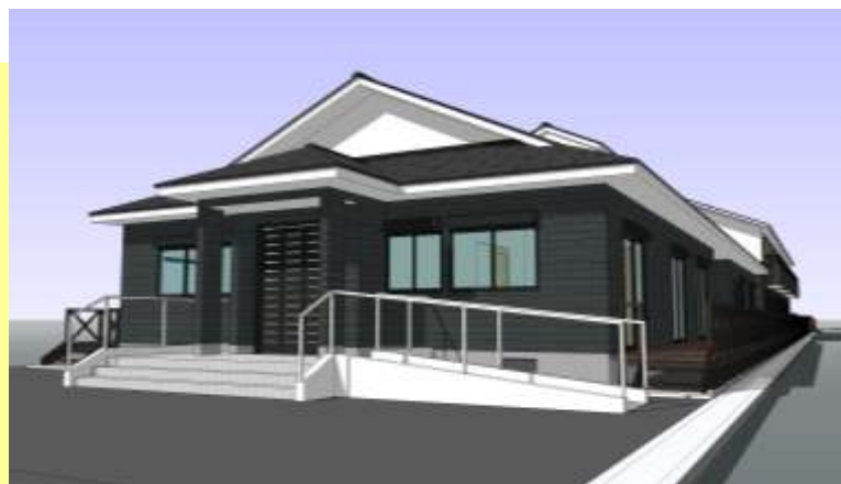
しあわせの杜 ケアレジデンスお福 (完成予想図)