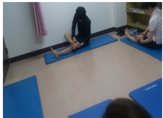
<フットコンディショニング>